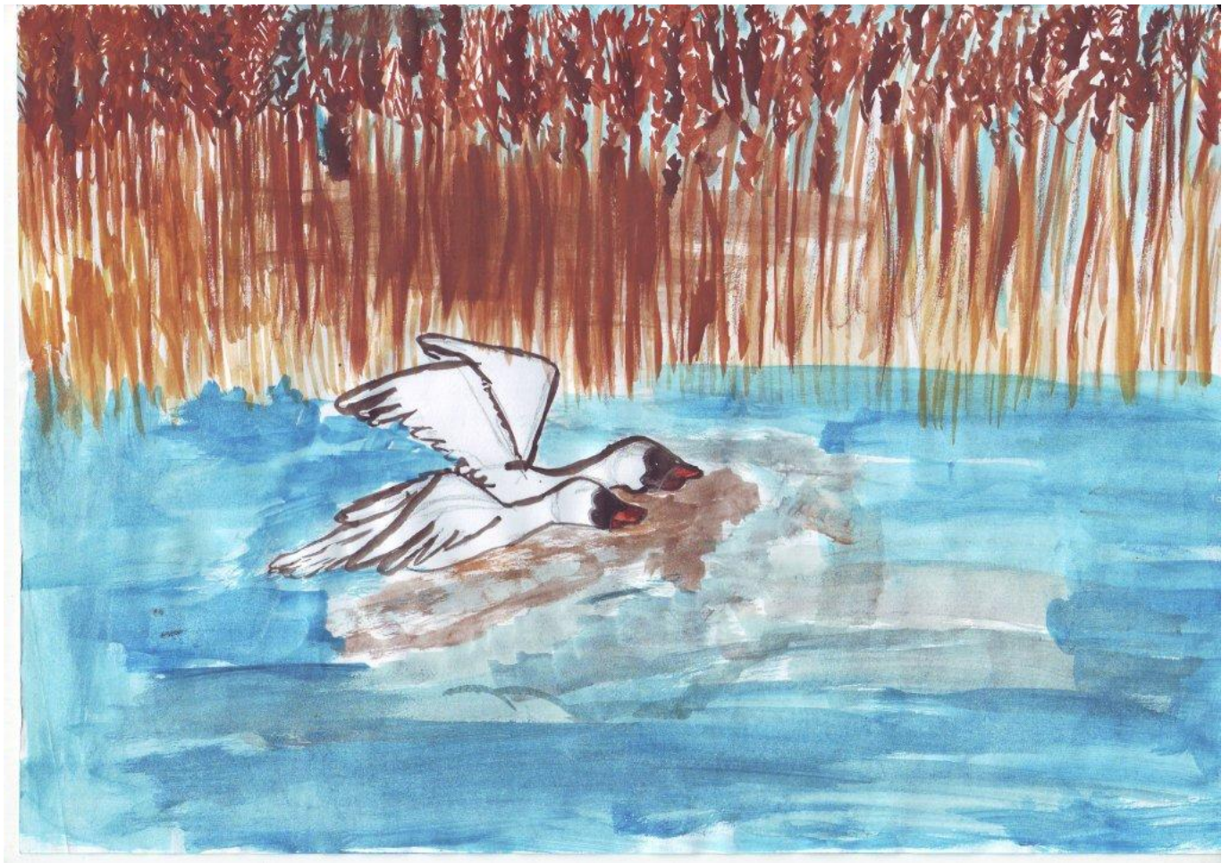
Wyróżnienie: Stanisław Szalach klasa Ib SP 6