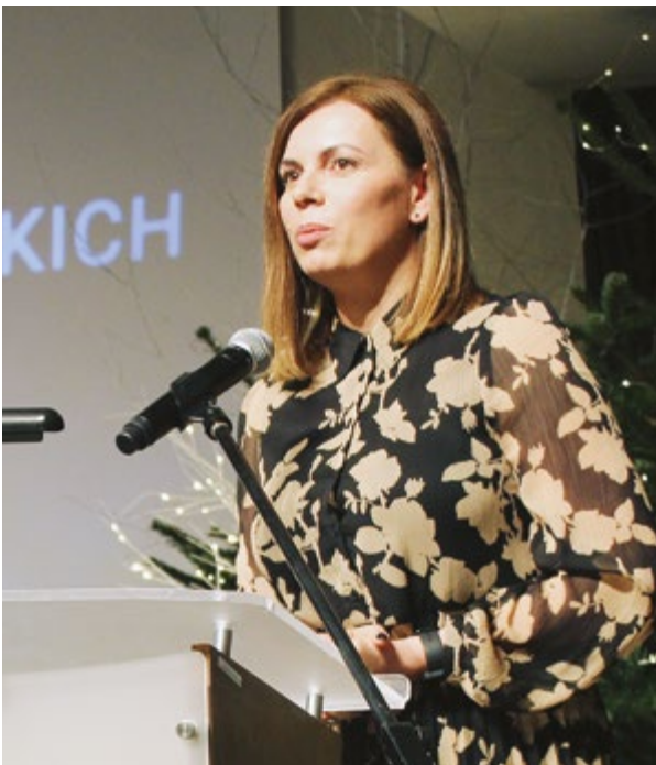
Centrum Spotkań Europejskich ŚWIATOWID