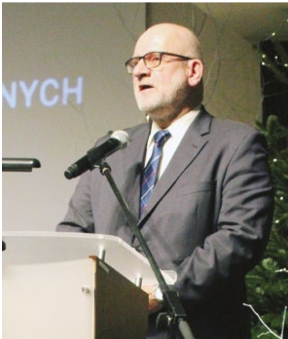
Zespół Szkół Mechanicznych w Elblągu