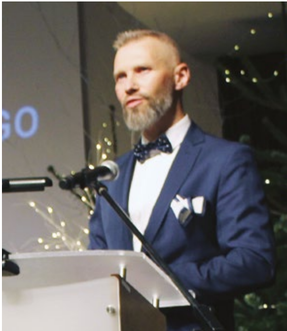
Dział Ratownictwa Medycznego Wojewódzkiego Szpitala Zespołowego w Elblągu