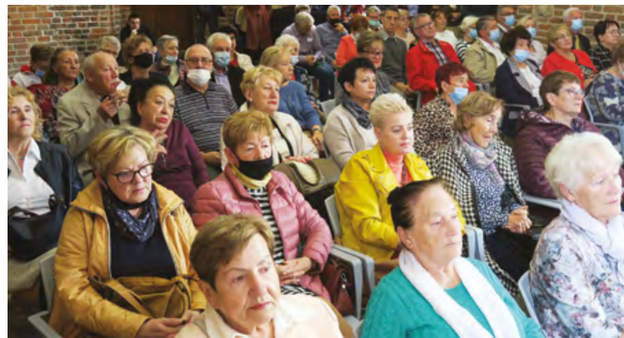
Uniwersytet III Wieku i Osób Niepełnosprawnych w Elblągu zainaugurował kolejny Rok Akademicki.