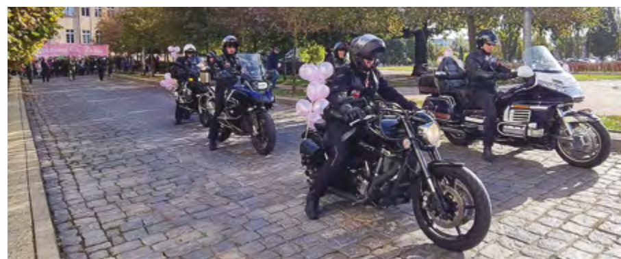
„Kocham Cię Życie” pod takim hasłem ulicami Elbląga przeszedł Marsz Zdrowia organizowany przez Elbląskie Stowarzyszenie Amazonek. Odbywa się on zawsze w październiku – Miesiącu Walki z Rakiem Piersi, aby przypomnieć o badaniach profilaktycznych.