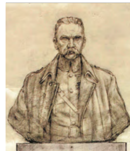
Pomnik Twórców Niepodległości

Organizator zastrzega sobie możliwość zmiany programu uroczystości, w przypadku wprowadzenia obostrzeń w związku z pandemią koronawirusa.